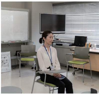
普段は性犯罪のプログラム処遇を行っている部屋にてインタビュー。(東京保護観察所)

ですから、いま覚醒剤をやっていないとしても、ODをやっているのだとしたら、そこをどう改善するかというところは犯罪予防のためにきちっと見なければいけません。