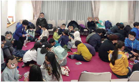
地域のお寺がみんなの居場所になっている。

同じ年ごろのお友達とはうまく遊べない子が、大学生のお兄さんの膝に座ったまま皆とトランプで遊んでいます。ゲームに負けても珍しく癩癩を起さず、お兄さんの「よおし、次は勝っちゃおうぜ！」という声掛けに笑顔で応えています。このお兄さんは、後に学校の先生となりました。