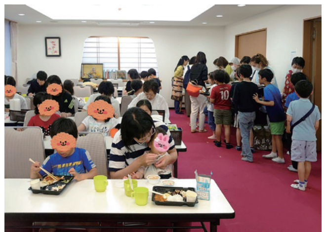
駒本小学校運営協議会の委員が主催している「定泉寺こども食堂」。ボランティアが、駒本小学校の家庭科室で調理し、定泉寺で配膳している。

もも、高学歴で高収入のご両親と暮らしています。これらの出来事から私は、「子どもが困ったときに安心して駆け込める場所を地域に作っていきたい」「孤独な子育て環境にいる親が、安心して悩みを打ち明けられる場所を作りたい」と強く感じました。