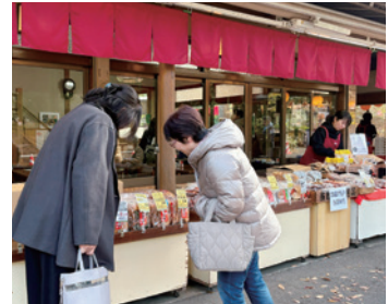
深大寺参道でお買い物