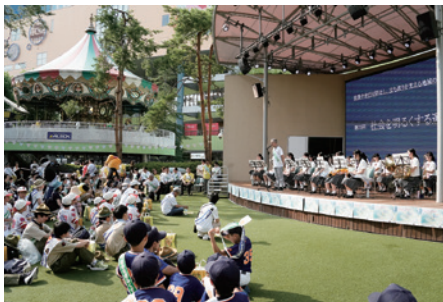
ラクーアでの広報啓発活動（2025年）

一つ目は毎年7月に行う「文京区社会を明るくする運動」の中の東京ドームラクーア周辺の広報啓発活動の時期を変える事について。この季節は毎年のように暑くなり参加者が頑張れば済むという気象状況ではなくなってきました。青少年が非行に走りやすくなる夏休み前に行う意義もありますが、それ以上に参加者の健康に配慮する必要があります。ま