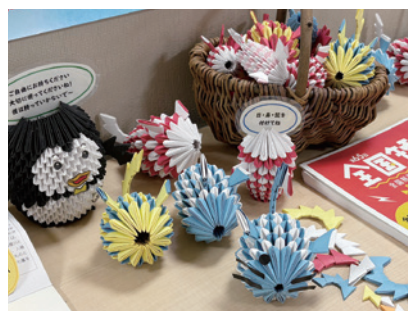
ブロック折り紙の作業品

三つ目、府中刑務所の折り紙を用いた作業品を買い取り配布を行う。ただしこれは会の活動ではなく、あくまでも有志の活動と位置付けています。