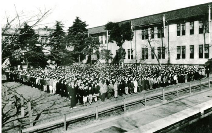
1940年頃の校舎と全校児童

家庭も多く、在校生と同じように百五十周年を祝い、今後の発展を願ってくださっています。