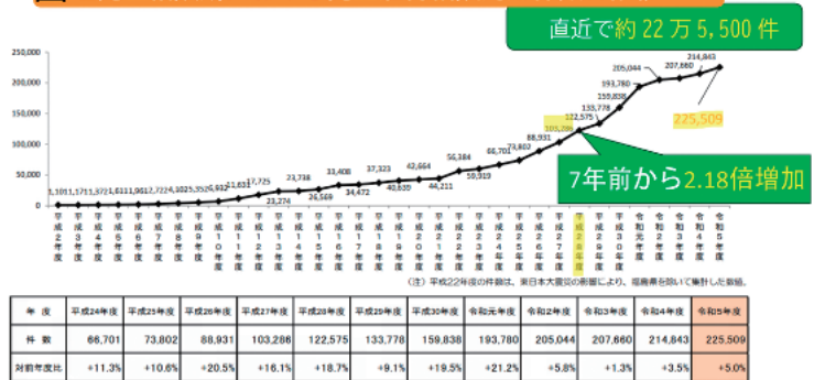
図1 児童相談所における児童虐待相談対応件数の推移

図1にあるように全国的に児童虐待件数は少子化時代であっても増加傾向にあり、相談経路は警察等が最